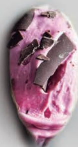
Crema de Cereza con Chocolate & Chili