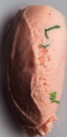
Tomate & Albahaca*