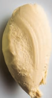
Castaña al Agua Caramel GASTRONÓMICOS