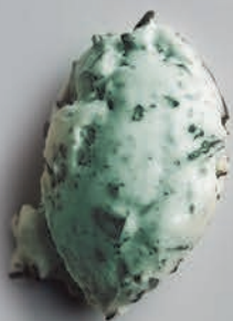
Queso Gorgonzola & Semilla de Amapolas