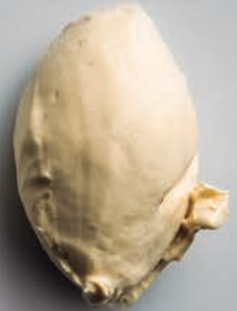
Crema de Banana