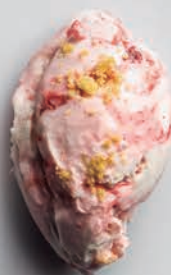
Cheese Cake Silvestre