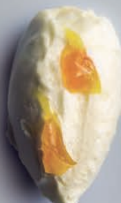
Yogur & Maracuyá