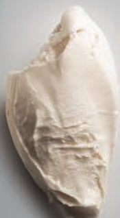
Aceite de Oliva Virgen Extra