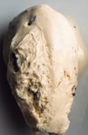
Cacahuete & Chocolate