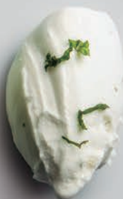
Lima, Jengibre y Hierbabuena