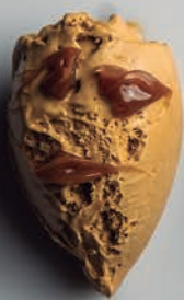
Dulce de Leche Tentación