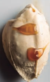
Nuez de Arce