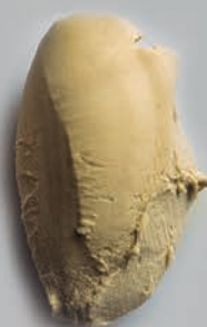
Pistacho Ibérico FRUTOS SECOS SELECTOS