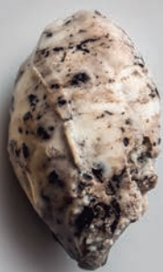
Menta y Chocolate

Con leche fresca de la Sierra de Guadarrama y materias primas de alta calidad.