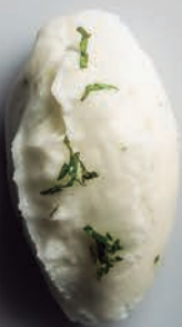
Sorbete de Mojito