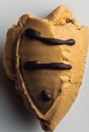
Dulce de Leche Porteño