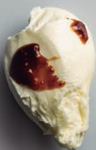
Crema Mascarpone & Dulce de Luche