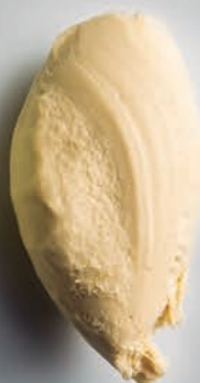
Vinagre de Módena*