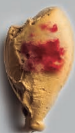
Dulce de Leche & Amarenas DULCES DE LECHE