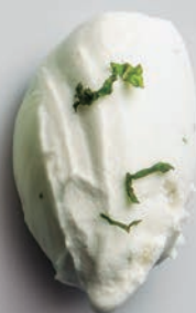
Chocolate blanco & Lima