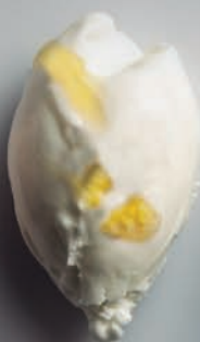
Yogur & Albaricoque