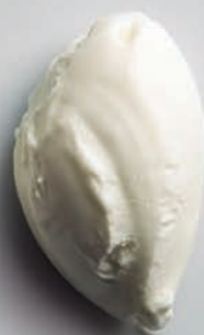
Queso de Cabra