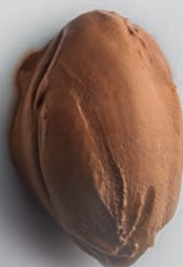
Chocolate & Leche