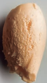
Zanahoria & Naranja