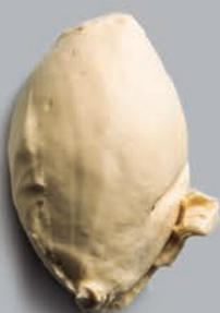
Baileys CON UN TOQUE DE ALCOHOL