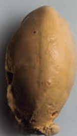
Café Tostado Natural GASTRONÓMICOS