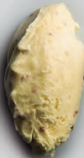
Ron & Pasas