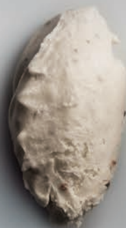
Crema de Trufa salada