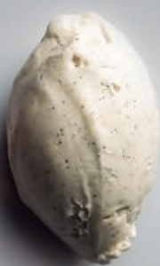
Vainilla Papua Nueva Guinea*