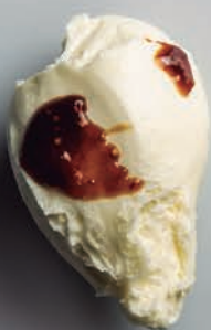
Crema Mascarpone e Higos