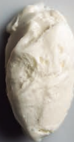
Coco Sri Lanka