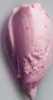
Caramelo Explosivo GASTRONÓMICOS