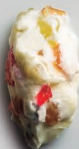
Roscón de Reyes