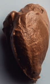
Chocolate con Naranja CHOCOLATES SELECCIÓN