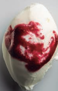
Yogur & Frutos Rojos