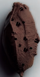
Chocolate Intenso Crujiente-Éboli