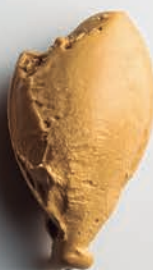
Dulce de Leche Argentino