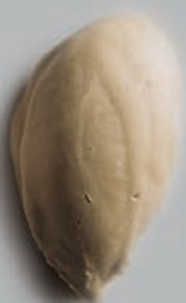
Regaliz Negro CREMAS HELADAS CLÁSICAS