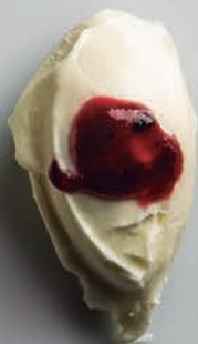
Crema Mascarpone & Frutos Rojos